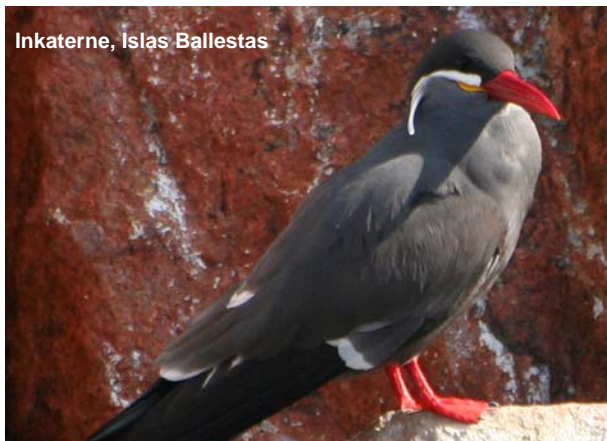
Inkaterne, Islas Ballestas

Vi arrangerer også gerne en forlængelse til Galapagosøerne eller en regulær fugletur til Ecuador og Galapagosøerne, som jeg researcher i fem uger i 2010 (Se s. 4 og 5).