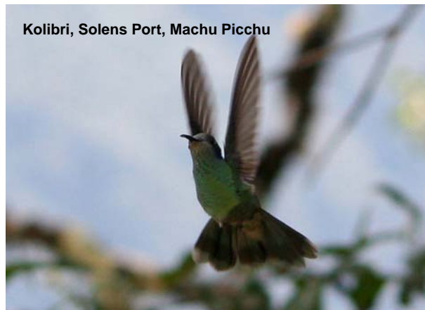
Kolibri, Solens Port, Machu Picchu

Telefon: 4248 4616 --- SKYPE: happylamatravel CVR-nr. 30829247 --- Rejsegarantifonden nr. 1940 www.go2peru.eu --- happylama@go2peru.eu