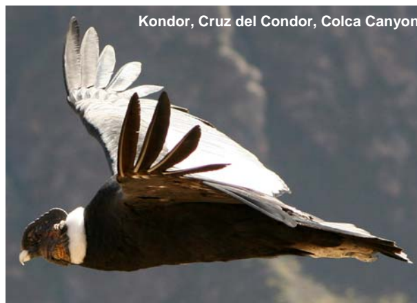
Kondor, Cruz del Condor, Colca Canyon

Peru er, pga. sin særegne geografi med kyst, ørken, bjerge og jungle, et af verdens bedste og mest alsidige lande at observere fugle i. Peru har mere end 1.800 fuglearter, hvilket er flere end det samlede antal fuglearter i Europa og Nordamerika - Et paradys for ornitologer og andre natur- og dyreelskere.