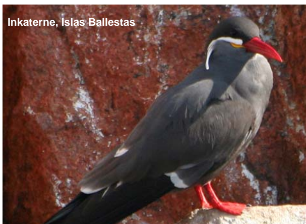
Inkaterne, Islas Ballestas

Vi arrangerer også gerne en forlængelse til Galapagosøerne eller en regulær fugletur til Ecuador og Galapagosøerne, som jeg researchede i fem uger i 2010.