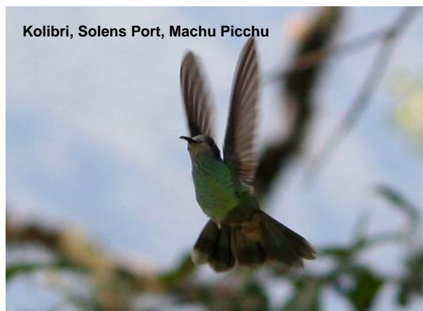
Kolibri, Solens Port, Machu Picchu