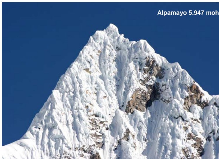
Alpamayo 5.947 moh.

Ankommer du til Alpamayo, og guiderne skønner at Alpamayo er for utilgængelig eller for vanskelig for dig, er det muligt at bestige nærliggende Quitaraju (6.036 moh.) fra samme basecamp. Quitaraju er mindre teknisk end Alpamayo.