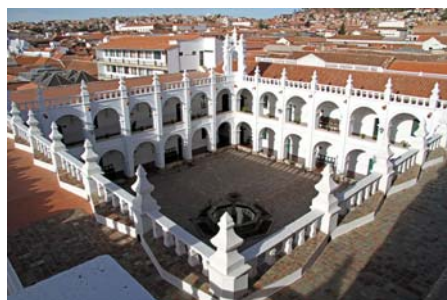
Sucre's koloniale centrum - Santa Clara