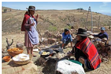
Jatun Yampara samfundet