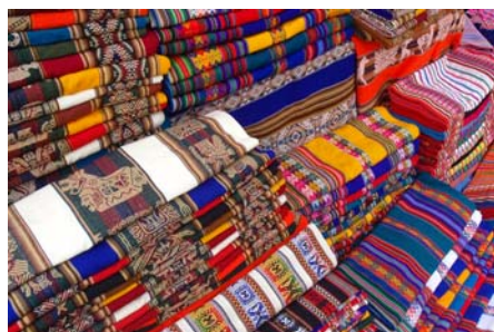
Søndagsmarked i Tarabuco