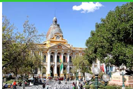
La Paz' koloniale centrum