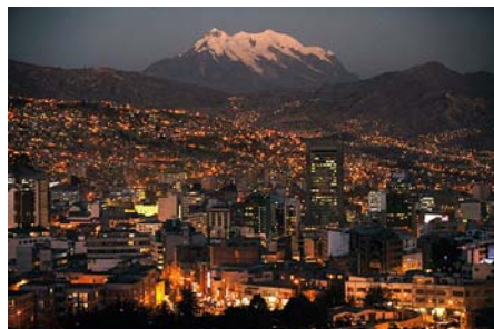
La Paz by night