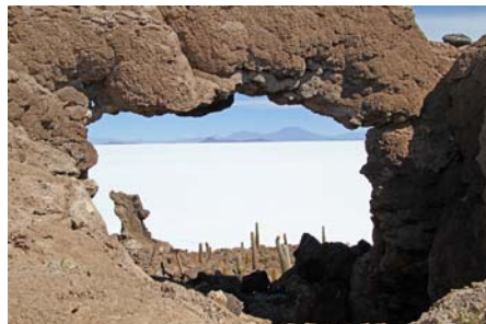
Uyuni saltsletten fra Isla Incawasi