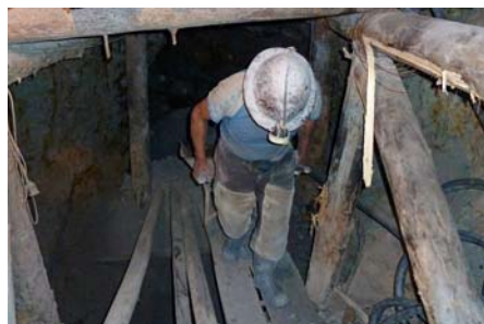
Sølvminedrift i Cerro Rico

Det kan på mange måder være en hård fysisk og mental oplevelse at besøge sølvminen, da de smalle, lave gange er støvfyldte, mudrede og uventilerede med store udsving i temperatur. I en mine er der desuden altid risiko for skred og nedstyrtning. Vi sørger for gummistøvler, lamper og dragter.