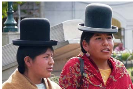
"Karakteristiske Cholitas" fra La Paz