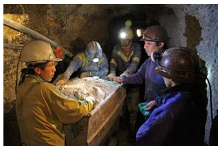
Sølvminedrift i Cerro Rico