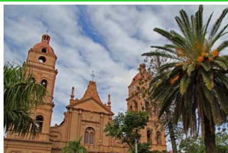
Katedralen i Santa Cruz