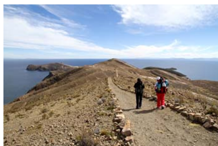
Isla del Sol