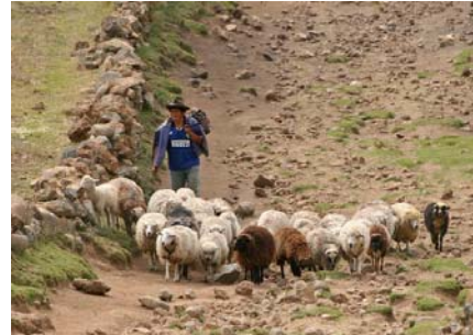
Trekking i Cordillera Negra