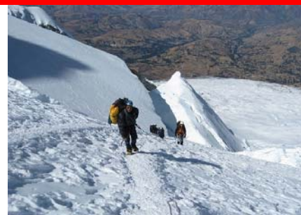
På vej mod toppen af Huascarán