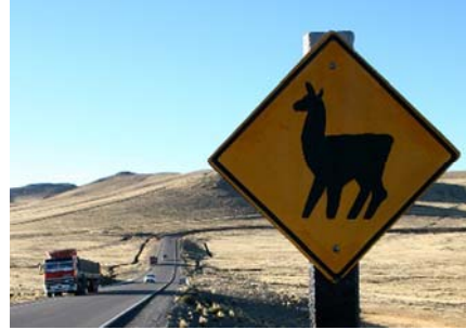
På vej mod Lima