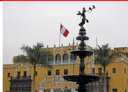
Limas smukke koloniale centrum

Individuelle forlængelser af rejsen kan desuden let arrangeres - Tag en snak med Jan Tvernø om mulighederne - Alt er muligt. M, -, -