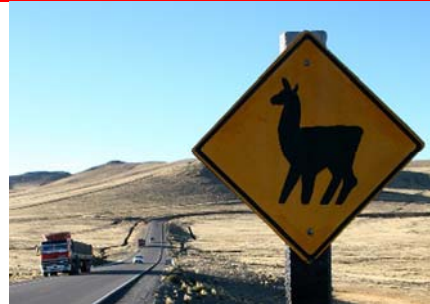
På vej mod Lima