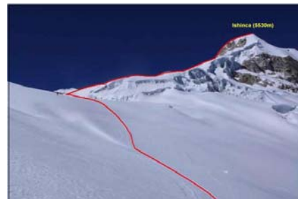
Ruten til Ishinca 5.530 moh.