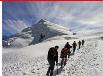
På vej mod Tocclaraju