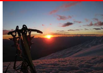
Solnedgang fra Huascarán