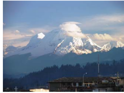
Perus højeste bjerg Huascarán 6.768 moh.

Højden er selvfølgelig også en faktor, men med forudgående trek og bestigning af Ishinca og Tocclaraju er vi optimalt forberedt på denne ultimative udfordring i Cordillera Blanca.