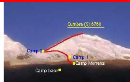
Ruten til Huascarán 6.768 moh.