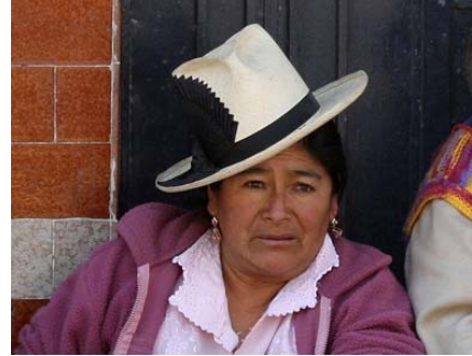
Markedet i Huaraz