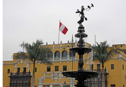
Limas smukke koloniale centrum

Individuelle forlængelser af rejsen kan desuden let arrangeres - Tag en snak med Jan Tvernø om mulighederne - Alt er muligt. M, -, -