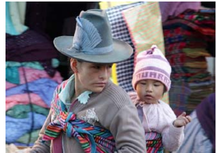
Markedet i Huaraz