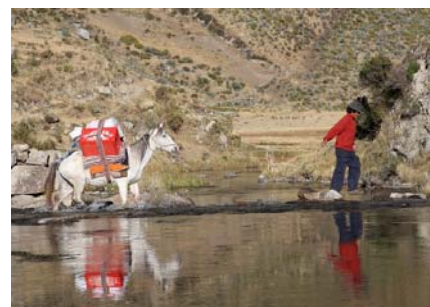
Heste og æsler er uundværlige i Cordillera Blanca