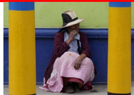
Avenida Luzuriaga, Huaraz