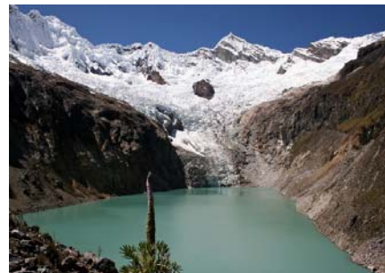
Typisk Cordillera Blanca landskab