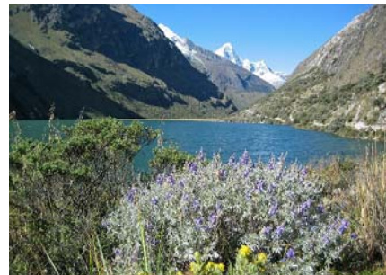
Santa Cruz dalen